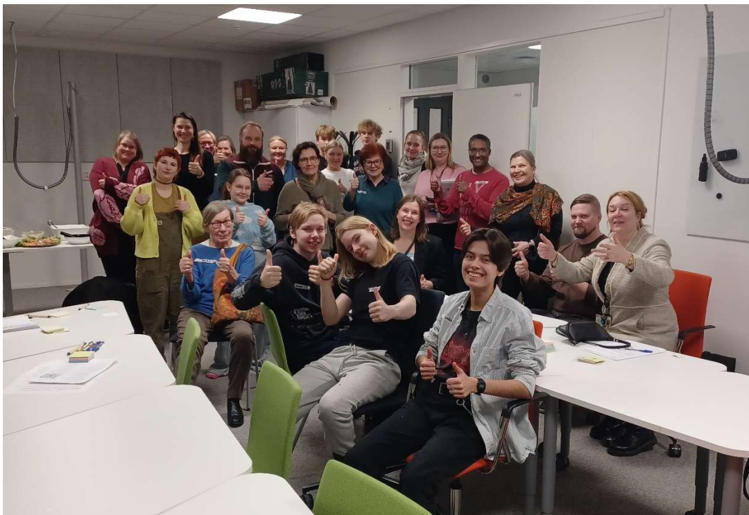
Kuvassa opetuksen ja kasvatuksen palveluverkkoraatilaisia ja fasilitaattorit.

Osallistujat saavat ennakkoon materiaalin sekä kysymyksen tai aiheen, johon heiltä toivotaan julkilausumaa. Osallistujat kuulevat keskeisiä valmistelijoita ja työskentelevät vuorovaikutteisesti puntaroiden sekä julkilausumaa demokraattisesti hioen.